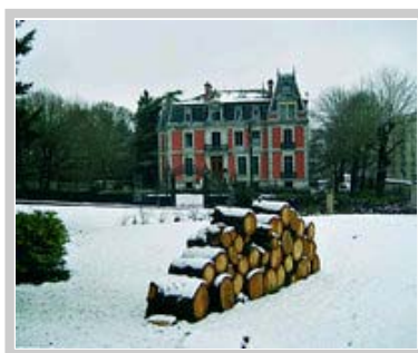
Hôtel Château Sallandrouze in die winter.