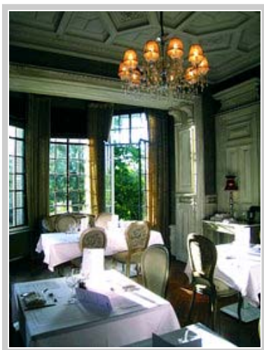
Hôtel Château Sallandrouze .