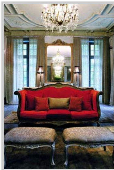
Dié 19de-eeuse herehuis is nou 'n luukse-hotel in Aubusson .