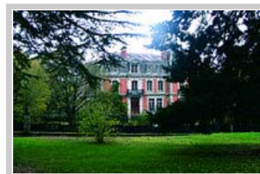
Hôtel Château Sallandrouze in die outydse dorpie Aubusson.