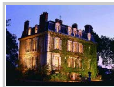
Château de la Creuzette op die naburige dorpie Boussac .