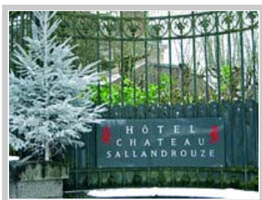
Welkom by die betowerende Hôtel Château Sallandrouze .